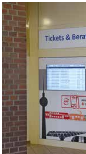
Die Eingangsansicht des Fahrgastzentrums