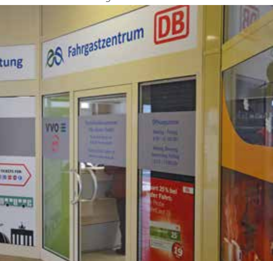
Fahrgastzentrums aus der Bahnhofshalle

https://verkehrsmanagement-elbeelster.de/fahrpreise/#Agenturen